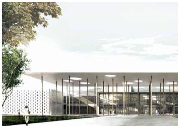
↑ Ospedale di Monopoli-Fasano