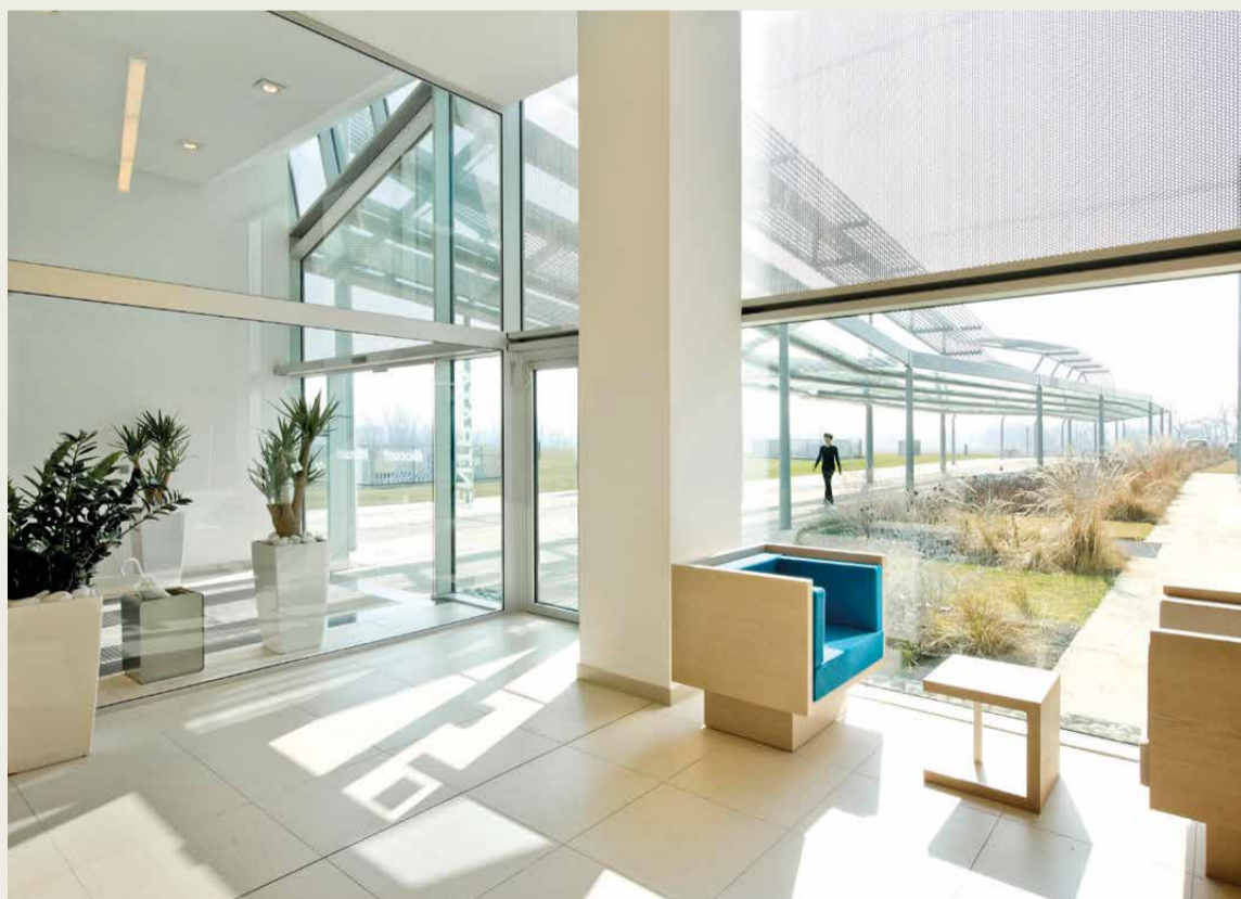
↑ Ingresso del nuovo headquarter Heidelberg Materials all'Innovation Campus di Peschiera Borromeo.