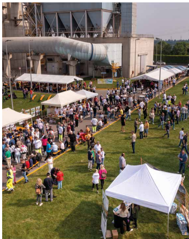
↑ Calusco, Porte Aperte 6 maggio 2023