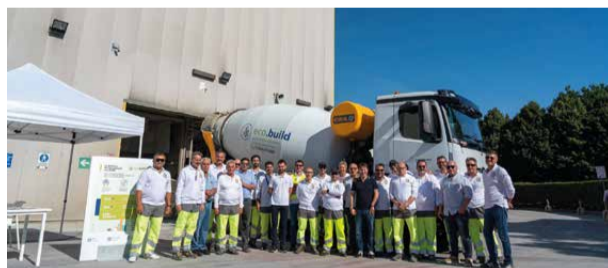
↑ Peschiera Porte Aperte 24 giugno 2023

zato su due grandi obiettivi come la sostenibilità e la digitalizzazione dei processi produttivi. Gli eventi erano inseriti nella più ampia cornice di eventi organizzati da Federbeton , la Federazione che racchiude l’intera filiera dei materiali da costruzione, che ha coinvolto complessivamente 17 impianti in tutta Italia.